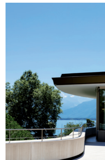
Clinique La Prairie Rue du Lac 142, Clarens-Montreux - + 41 21 989 34 66 www.laprairie.ch ch - info@laprairie.ch

Et puisque l'équilibre physique ne peut que bénéficier d'un esprit reposé, l'approche médicale se complète d'une activité physique modérée visant à la relaxation - notamment par le yoga - et par des soins dispensés au cœur de l'impressionnant spa de la Clinique - en tout, neuf soins sont proposés pendant la semaine, du massage viscéral à la photostimulation en passant par le soin cellulaire. Et comment se sent-on quand vient le mot de la fin ? « Allégé au propre comme au figuré, dans un état d'homéostasie, c'est à dire que l'équilibre interne a été restauré ». Entre vraie assise scientifique et luxueux confort, pas étonnant que la Clinique soit un endroit où l'on revient se faire du bien.